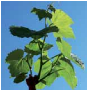
PILGRIM vid