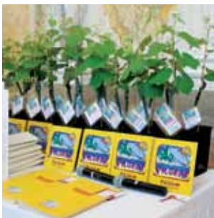
Paneles PILGRIM y cepas

Cada PILGRIM-institución obtiene un certificado oficial.