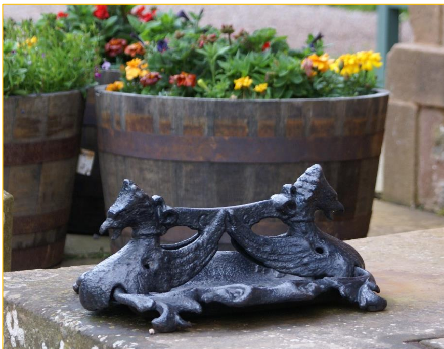
Ein Fußabstreifer in Schottland.

PILGRIM ist auf finanzielle Unterstützung angewiesen, um ambitionierte Ziele erreichen zu können: AT87 3200 0000 1157 1296 (IBAN), RNLNAT22 (BIC)